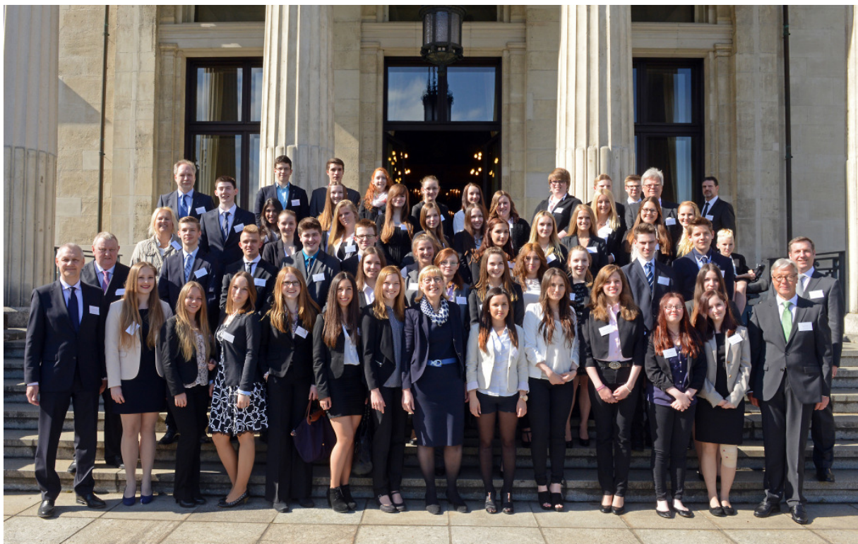
Los becarios que participaron en unas prácticas de cuatro semanas de duración en el extranjero.

Mediante estas prácticas de cuatro semanas de duración, los becarios tendrán la oportunidad de formarse una idea inicial de la vida profesional, mejorar sus conocimientos de idiomas extranjeros, así como conocer una cultura que hasta ese momento les es ajena. Además, los escolares se verán confrontados con las exigencias profesionales que en el futuro se les plantearán, preparándose así para la vida profesional de forma más definida.